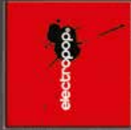
electropop Various Artists CD + CD + 3CD-R