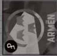
Poppjee Fabrikk Armen CD + CD BOX + VINYL