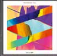
20 Years - The Simplex CD + VINYL