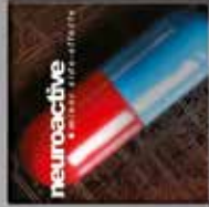
Neuroactive Minor Side-Effects CD