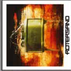
Rotersand How Do You Feel Today CD + CD + VINYL