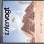
funkervogt Conspiracy MCD