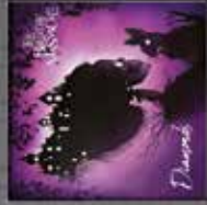
The Birthday Massacre Diamonds CD + VINYL