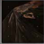
IAMX Echo Echo CD