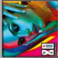
Blind Passenger 80s Express CD